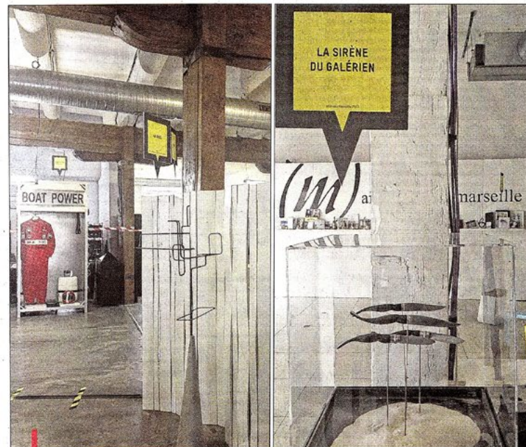
La sirène du Galérien de Charles Bové, un couteau made in Marseille.

On y trouve tout naturellement un bout de Mucem conçu par Rudy Ricciotti, des éléments de BFUP, ce béton fibré à ultra haute performance qui font la marque du bâtiment. À côté, pas en béton,